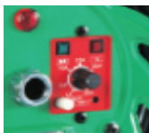
15A・30Aの切替機能 (実用新案特許申請中)