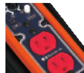
15A・30Aの切替機能 (実用新案特許申請中)