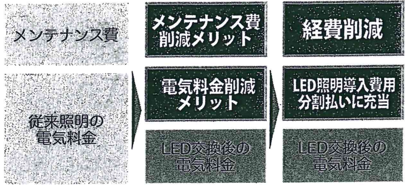
現状照明の場合 LED照明に交換 削減コストの一部を導入費に

環境コンサルティング会社あかりみらいは、昨年4月の電力完全自由化以来、数多くの企業に信頼の高い新電力を紹介。LED照明の導入と併せて、省エネ化・施設維持コストの低減を提案している。